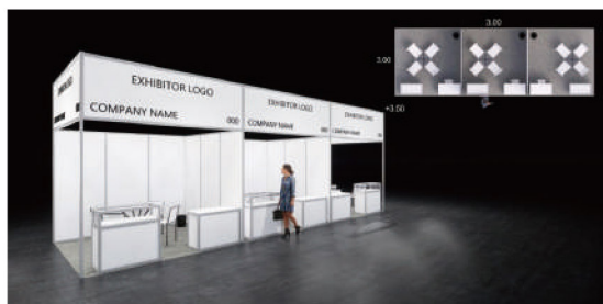
Skema Shell Deluxe