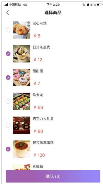
图 1-3 选择带货商品