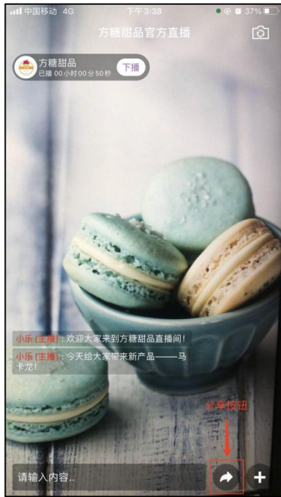
图 2-1 直播视频推流与分享（主播方）

开始直播后，直播视频流开始推送，用户可以通过扫码或者链接进入网页观看直播。主播可以通过分享将直播间的链接或二维码分享给用户。如图 2-1，2-2。