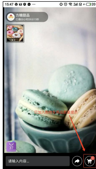
图 7-2 购物车数量提示（用户方）

选购完毕，用户点击购物车进行商品结算，跳转到订单确认页面；当然，也可在之前的步骤点击「立即购买」直接跳转到订单确认页面。如图 7-3，7-4。