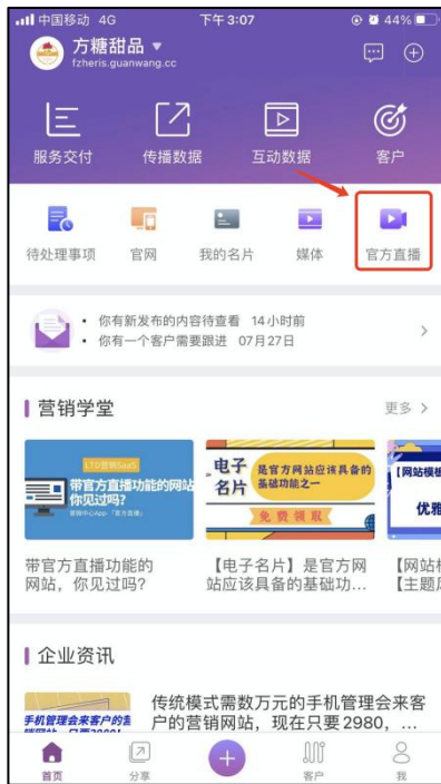
图 1-1 「官方直播」入口

打开官微中心 App，选择「官方直播」功能，进行直播信息的编辑。如图 1-1，1-2。