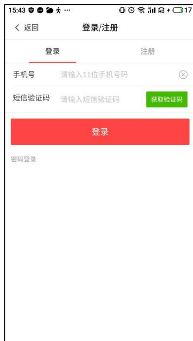
图 4-1 登录界面（用户方）

用户需登录官方商城才能对商品进行购买。登录与注册界面如图 4-1，4-2 所示。