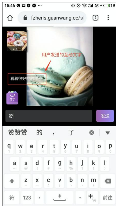
图 5-1 向主播发送互动信息（用户方）

用户登录后，可以发送文字与主播互动，主播能看到对应的互动文字。如图 5-1， 5-2。