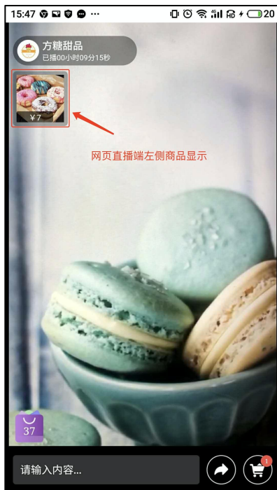
图 6-1 商品呈现（用户方）

当商品上架后，用户可在直播界面左侧看到商品，商品会显示商品图片与价格；点开商品会显示商品名称、价格与库存，用户可以选择购买数量加入购物车或立即购买。如图 6-1， 6-2。