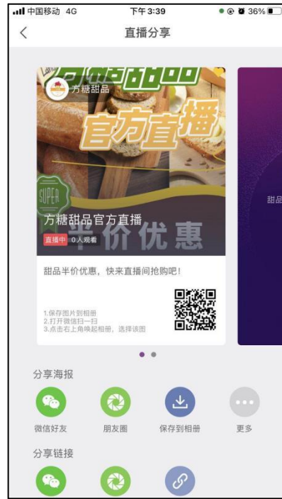
图 2-2 直播分享页面（主播方）

直播过程中上架带货商品，供用户购买，商品上架后会在屏幕左侧显示，如图 2-3，2-4。