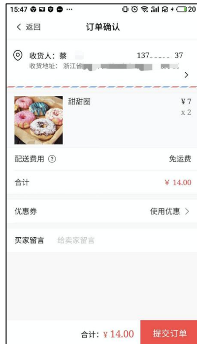
图 7-4 订单确认页面（用户方）