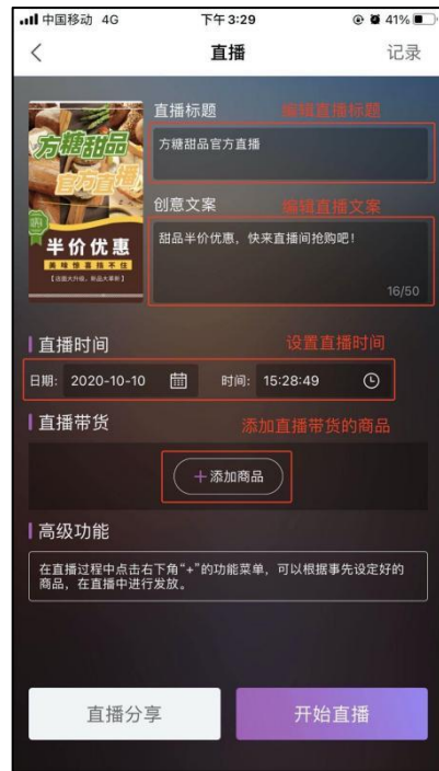
图 1-2 编辑直播信息