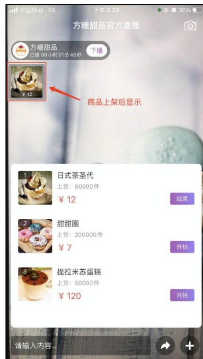
图 2-4 商品上架后显示（主播方）