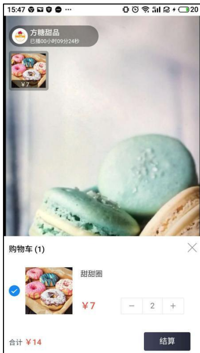
图 7-3 购物车结算（用户方） 提交订单，支付成功即完成购买。

选购完毕，用户点击购物车进行商品结算，跳转到订单确认页面；当然，也可在之前的步骤点击「立即购买」直接跳转到订单确认页面。如图 7-3，7-4。