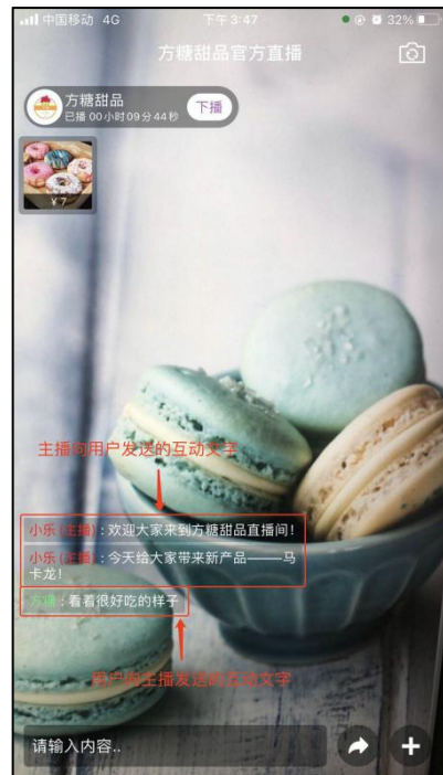
图 5-2 主播看到的互动信息（主播方）