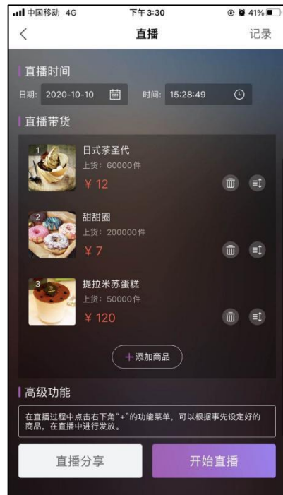
图 1-4 准备直播