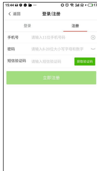
图 4-2 注册界面（用户方）