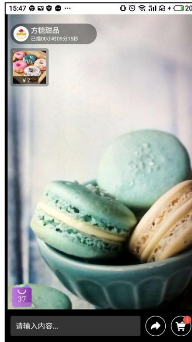
图 3 网页直播端（用户方）

用户获取直播间链接或者扫码后，可以在任一浏览器中观看官方直播。网页直播端的呈现如图 3 所示。