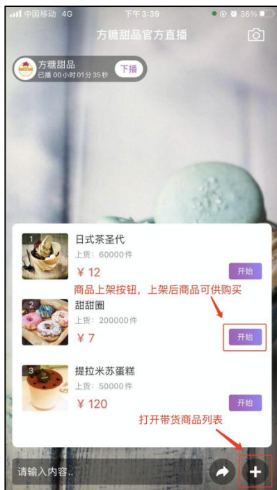
图 2-3 选择带货商品上架（主播方）

直播过程中上架带货商品，供用户购买，商品上架后会在屏幕左侧显示，如图 2-3，2-4。