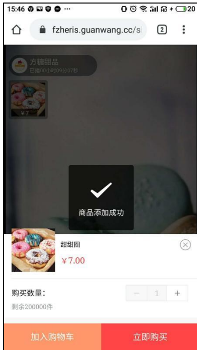
图 7-1 系统提示（用户方）

用户将商品加入购物车后，系统会提示「商品添加成功」，购物车会在右下角显示已选商品数量。如图 7-1，7-2。